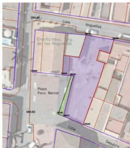
Planta general parcela modificada y Superficie cedida