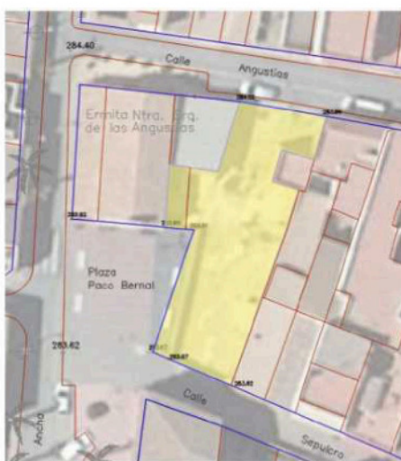
Planta general parcela original

El Estudio de Detalle afecta parcialmente a la parcela de suelo urbano ubicada en C/ Santo Sepulcro, 71 con referencia catastral 3589102WG9338N0001WP, con una superficie de 316.81 m2 y al espacio urbano denominado Plaza Paco Bernal.